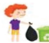
sacar la basura