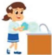
Lavar los platos

3 Observo algunas actividades que debo realizar para ayudar en casa y descubro cómo se escriben las palabras.