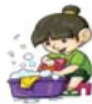
Lavar la ropa