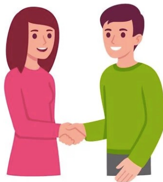
Imagen 1: Freepik, (s/f). Recuperado de: https://bit.ly/3MOOqTP Imagen 2: 123rf, (s/f). Recuperado de: https://bit.ly/3aZvRPE