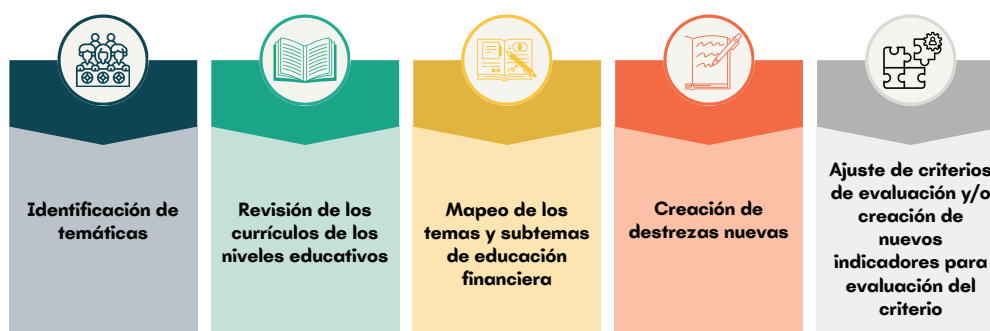
Figura 2. Metodología de construcción de la inserción de Educación Financiera.

Nota: Elaborado por el equipo técnico de la Dirección Nacional de Currículo