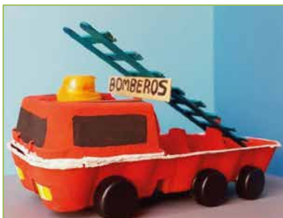
Carro de bomberos